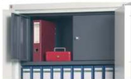
Innenfach mit Zylinderschloss.