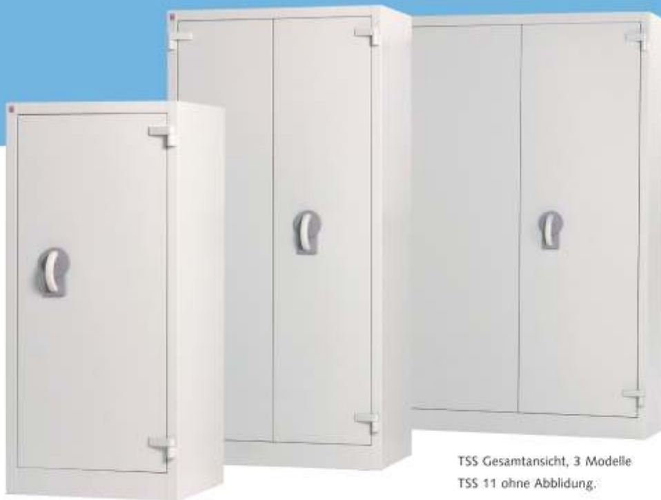
TSS Gesamtansicht, 3 Modelle TSS 11 ohne Abbildung.