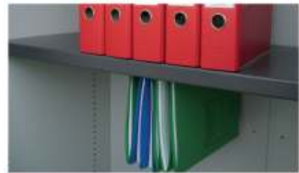
Fachboden in französischer Ausführung, Abhängung von Hängeheftern durch vorbereitete Aufnahmevorrichtungen (Kantungen).