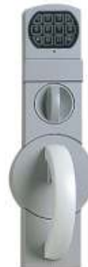
Elektronisches ZKS La Gard Basic.