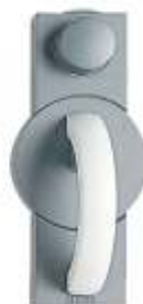
Grundmodul mit Zahlenkombinationsschloss, mechanisch.