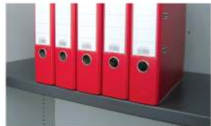
Standard Fachboden inkl. 4 Stk. Bodenträger, vernickelt.