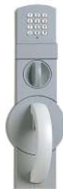
Grundmodul mit ZKS, elektronisch (Code-Combi-B mit Revisionsschlüssel).