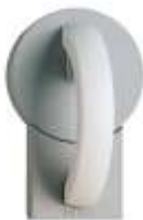
Grundmodul mit Doppelbart-Sicherheitsschloss.