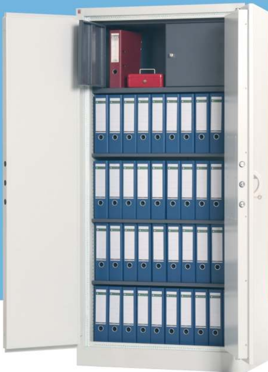
Tresorschrank TSS 2: Sonderausstattung mit Wertfach.

Aufgrund der Bauweise bietet Ihnen der TSS bedingten Einbruch- und Feuerschutz nach DIN 4102. Wenn Sie auf „geheimen Verschlussachen“ Wert legen, sollten Sie Qualität und Service der SISTEC Sicherheitssysteme in Anspruch nehmen.