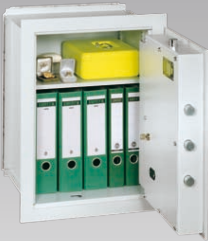
Abb.: VNO 6