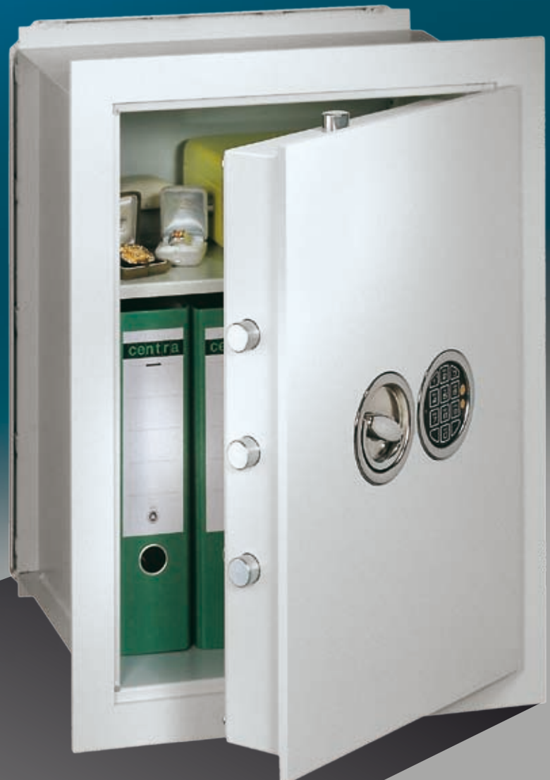
Abb.:VNO 6 (mit Sonderausstattung EZ LG Basic versenkt)